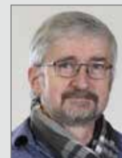
Ortschaftsrat Roßlau Stadtrat

Für ein ausgewogenes Miteinander von Jung und Alt in unserer Doppelstadt