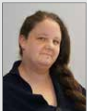
Ortschaftsrat Roßlau Stadtrat