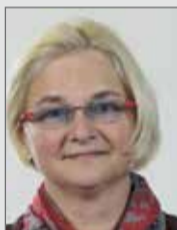
Ortschaftsrat Roßlau Stadtrat

Wirtschaftsförderung heißt, innovativen Fachkräften in Dessau-Roßlau optimale Anreize zu bieten