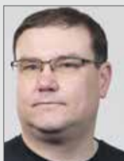
Ortschaftsrat Meinsdorf Stadtrat