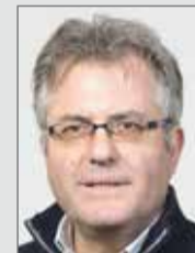
Ortschaftsrat Roßlau Stadtrat

Erfolgreiche Stadtentwicklung verlangt viel Erfahrung, aber auch junge und neue Ideen